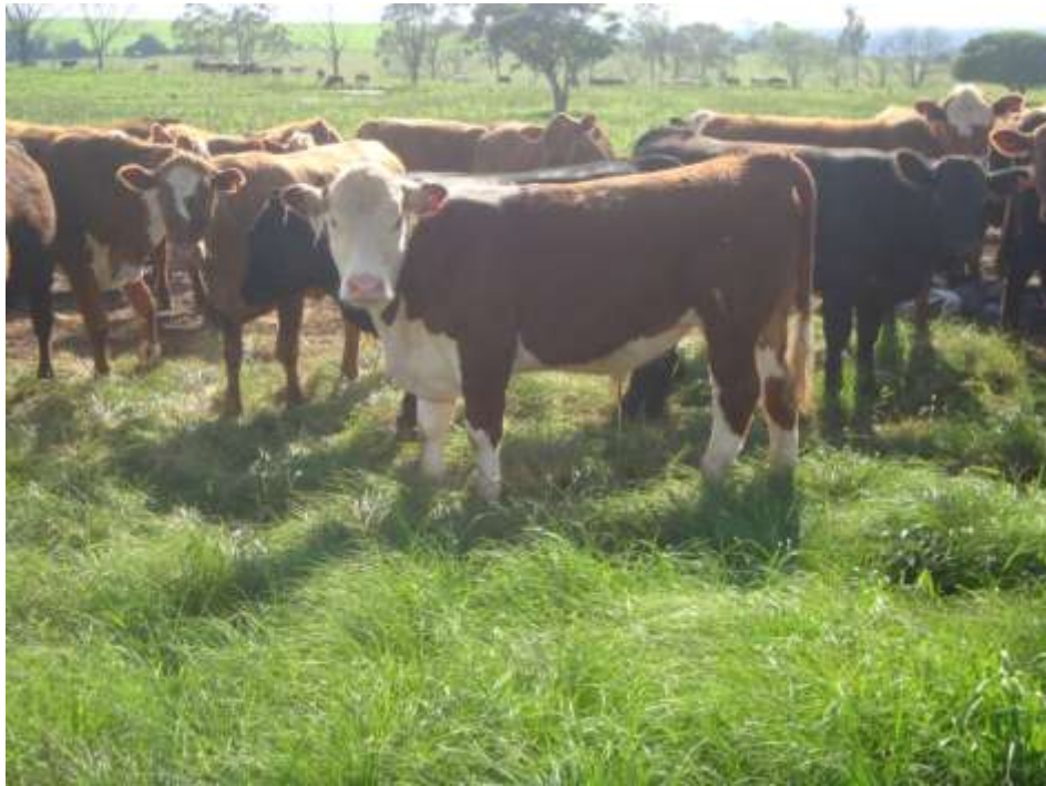
Novilhos em pastagem que serão levados ao confinamento