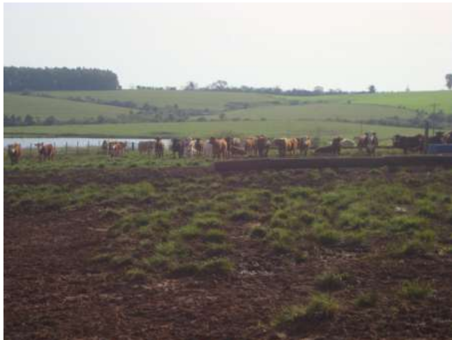
Lote de novilhos no confinamento prontos para abate